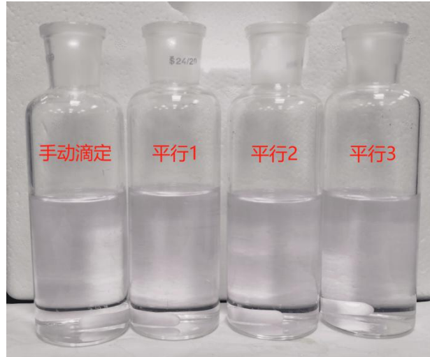
图-4 质控样测试-滴定最终颜色