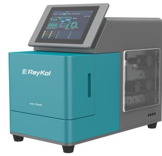
睿科 Auto Titra 08 全自动滴定仪